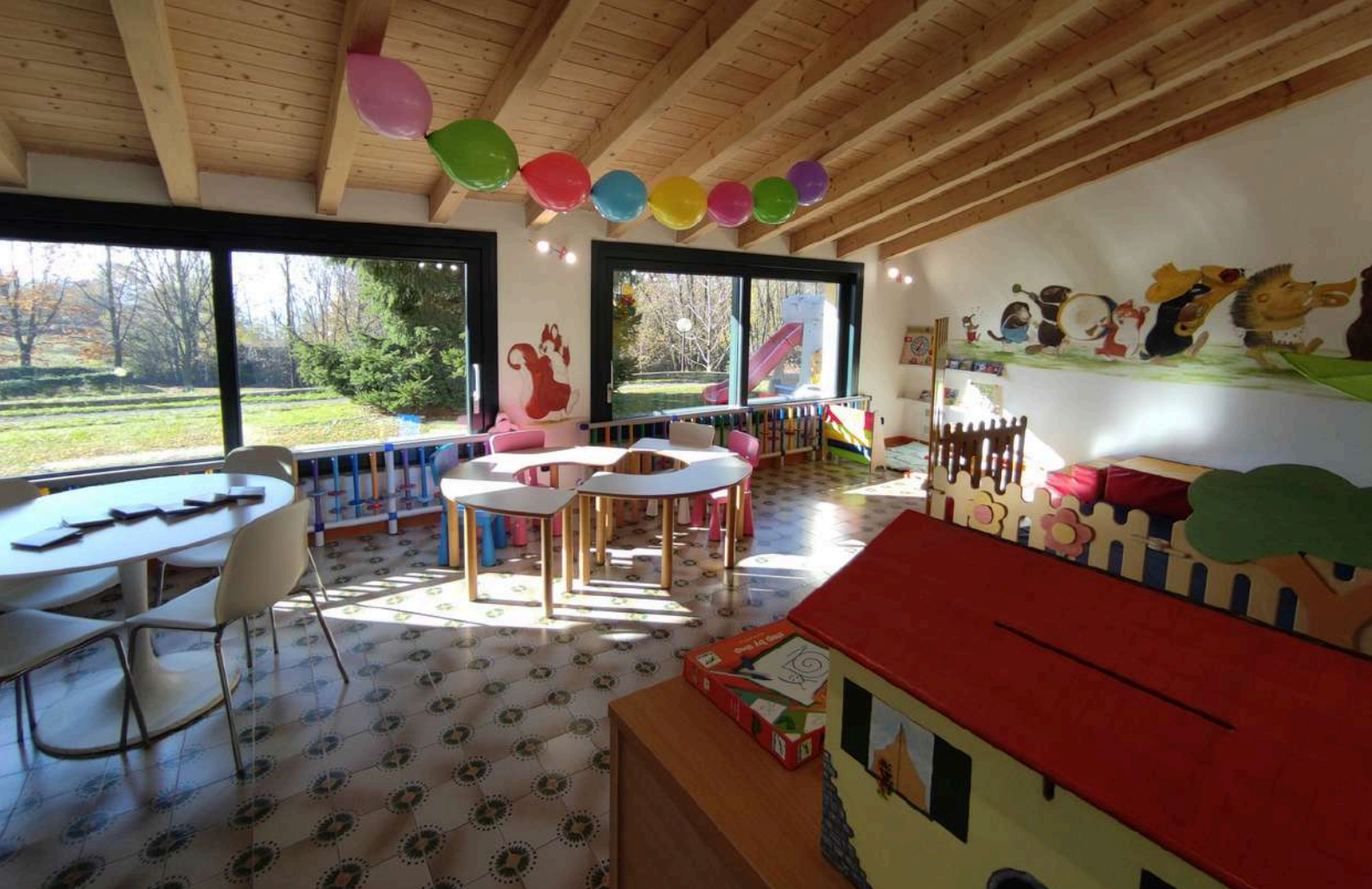
In alto lo Spazio Primavera, in basso lo Spazio Neutro.